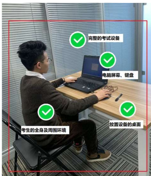
图四：佐证视频监控视角