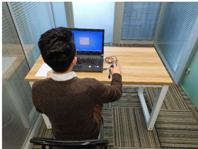
图二：电脑端背面视角